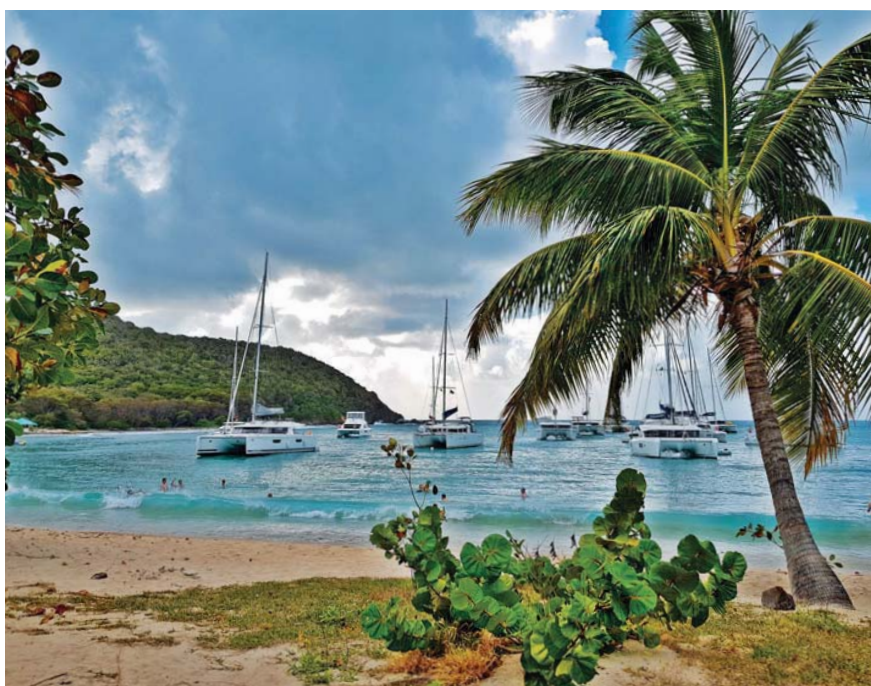
Kotvení katamaranů během zimní plavby

Kromě programu na moři pořádáme dvě regaty na českých vodách, které organizujeme nejen jako závod, ale také jako společenské setkání lidí se stejným zájmem. Potkáme se s kamarády, podělíme se o zážitky a zkušenosti a naplánu-