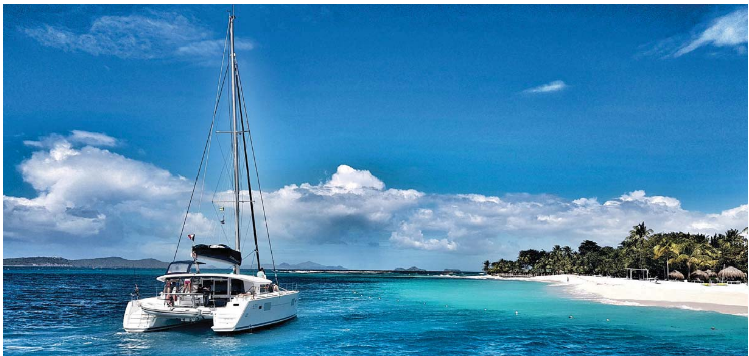
Kotvíme u ostrova Palmi Island na Grenadinách.

Champagne Cup byl úspěšný a stal se pro nás výzvou a motivací k tomu pokračovat. Prvními zákazníky byli naši kamarádi a jejich známi, pro které jsme dělali klubové akce. Před dvaceti lety se širší jachtařská veřejnost s tímto fenoménem teprve seznamovala. Lidé, kteří se