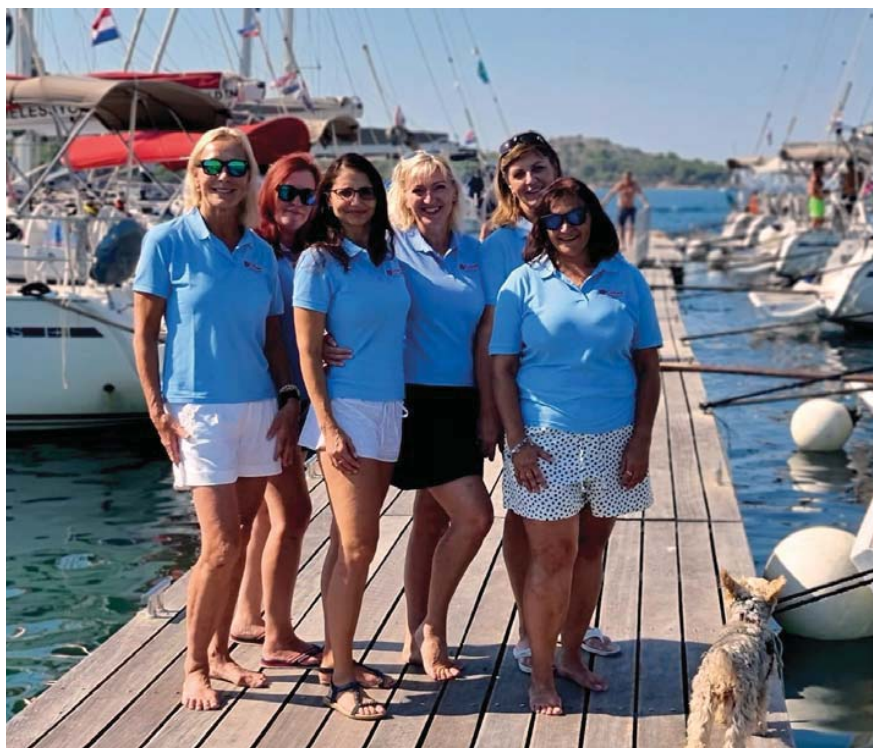
Colins Yacht tým na regatě Champagne Cup