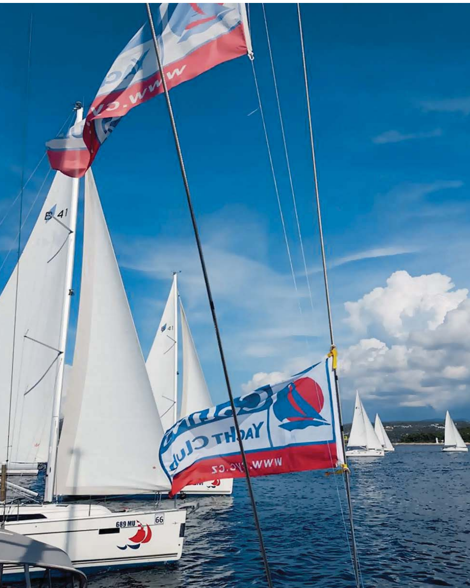
Start regaty v Chorvatsku

jeme další plavby. Na Orlické přehradě pořádáme letos již šestnáctý ročník tradičního závodu Izolepa Cup 31. července v Marině Orlík. Za tento neobvyklý název nemůže žádný sponzor, ale klasická stříbrná lepicí páska, která je nezbytnou výbavou na každé lodi, protože se s ní dá opravit téměř vše. Dalším naším závodem v Čechách je Slapseidon. Letos se pojede 13. srpna a jak napovídá název, koná se na přehradě Slapy již po jedenácté.